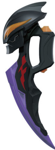
ベリアアロク本体…1