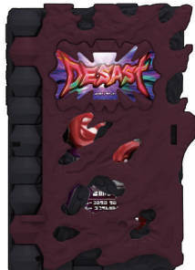
デザスト アルターライドブック…1