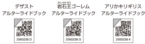
アルターライドブックステッカー