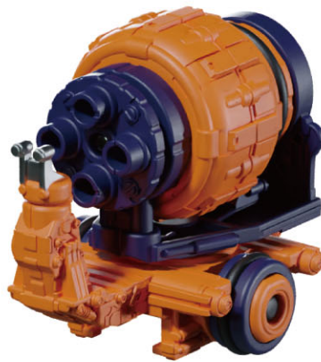
ガーディアンズネイル…1