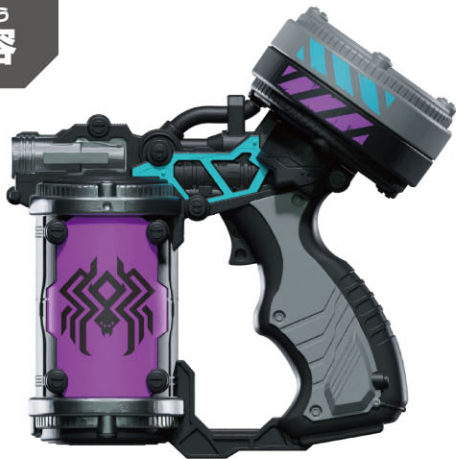
ヴェノミックスシューター本体…1