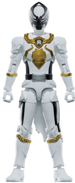
スパイダークモノス本体…1