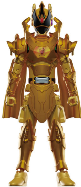
キングクワガタオージャー本体…1