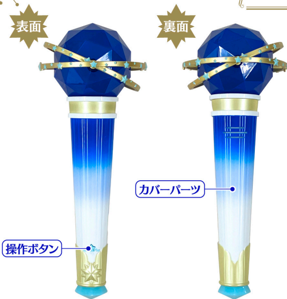
★ すいちゃん専用マイク本体...1