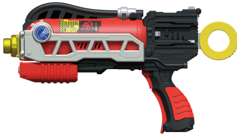
ズンズンショウカブラスター本体…1