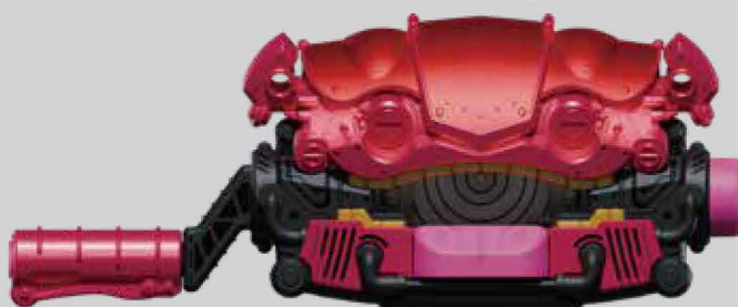
へん しん 変身ベルトガヴ